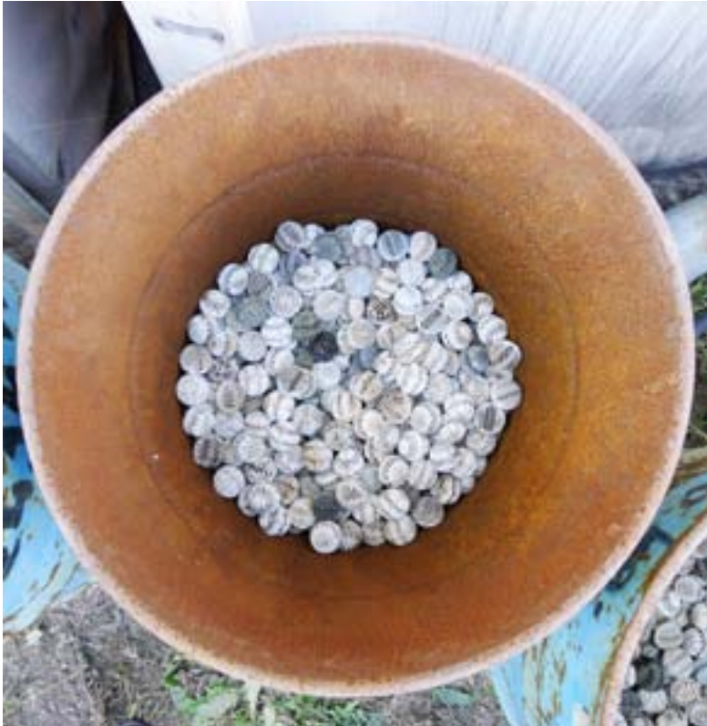
9 nuotrauka. Kibiras su formuotais plastikiniiais rutuliukais, kuriais užterštoje vietovėje ištraukiami požeminiai teršalai (Dunauivarošas Vengrija)