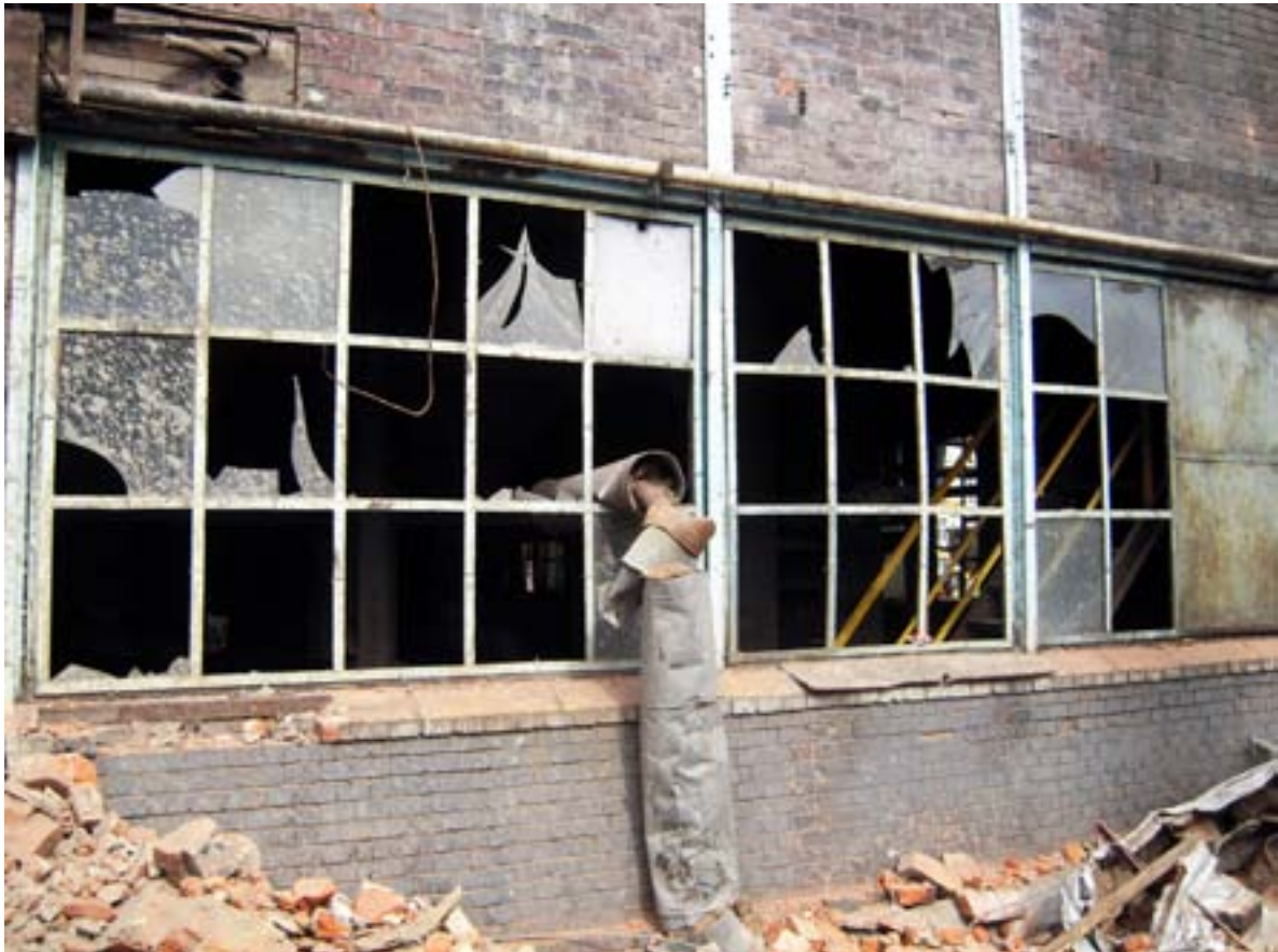
8 nuotrauka. Šalia neveikiančios elektrinės, pertvarkomos į kultūros ir meno centrą, nugriaunami ir renovuojami seni pastatai (Lodzė, Lenkija)