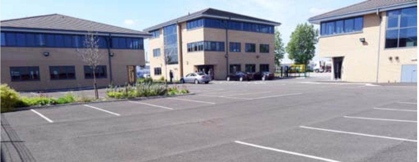
6 nuotrauka. Buvusių cheminių medžiagų gamyklos vietoje statomi parengti naudoti biurai (Vidnesas, Jungtinė Karalystė)