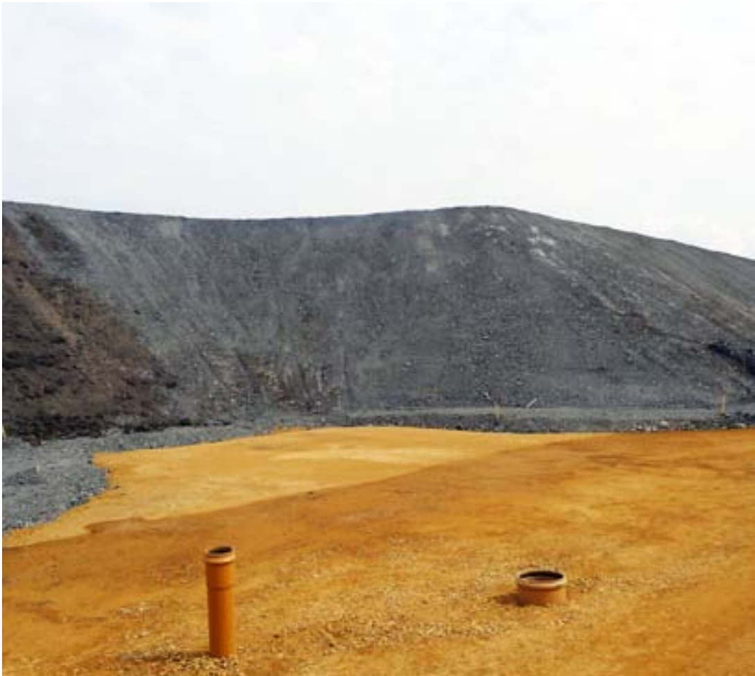
Kuva 10 – Tieinfrastruktuurin rakentamista varten valmisteltu maa-alue entisen hiilikaivosalueen kaivosjätealueella (Jaworzno, Puola)