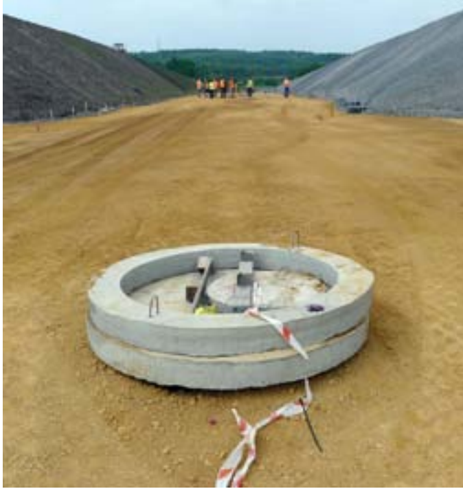
4. foto. Teede- ja kommunaalvõrkude ehitus endise söekaevanduse alal asuvatele puistangutele (Jaworzno, Poola)