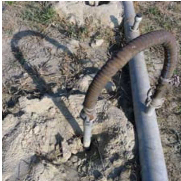
2. foto. Terasetehases puhastusvedelikke saastatud maapinda suunav toru (Dunaujvaros, Ungari)