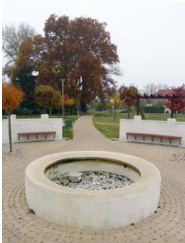
5. foto. Linnapark, mis asub endise akutehase alal, kus tehti saastusest puhastamise töid ja ehitati pargirajatised (Marcali, Ungari)