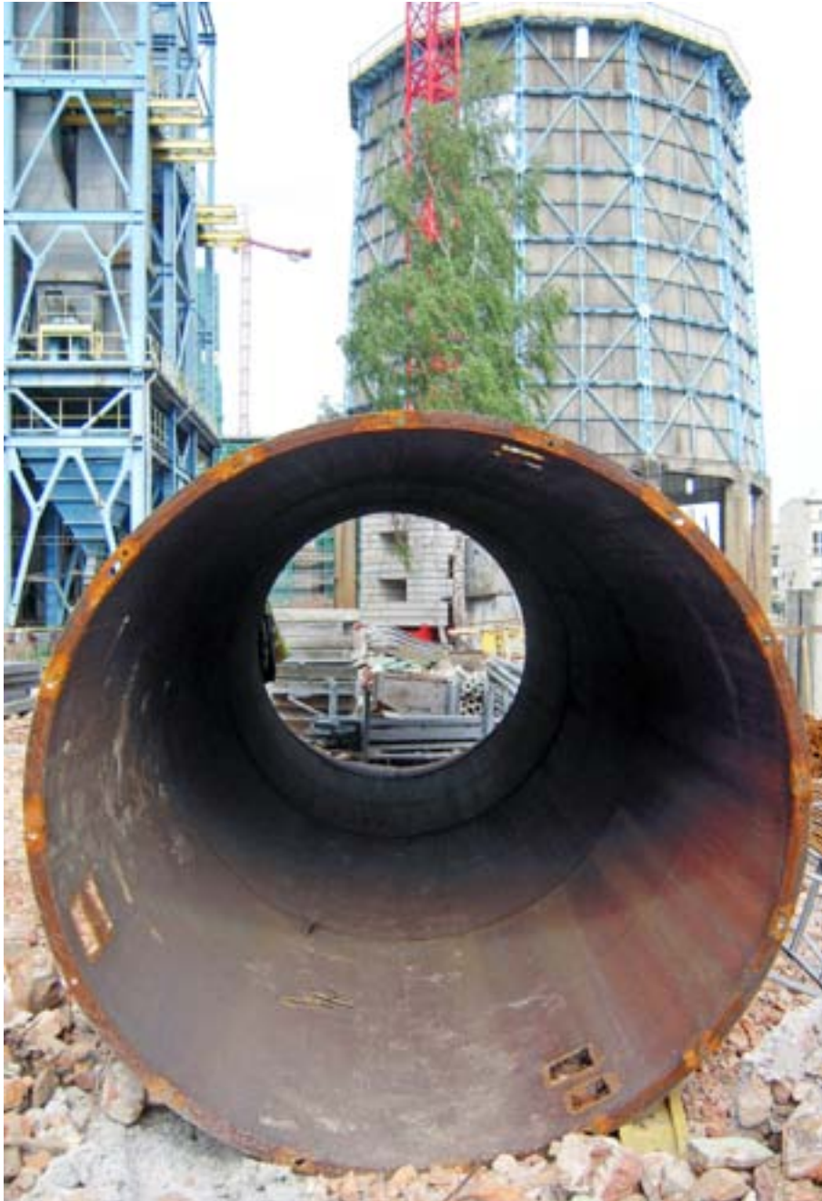
1. foto. Kesklinnas asuva mahajäetud elektrijaama legendaarse torni renoveerimine ning selle ümberkujundamine kunsti- ja kultuurikeskuseks (Łódź, Poola)