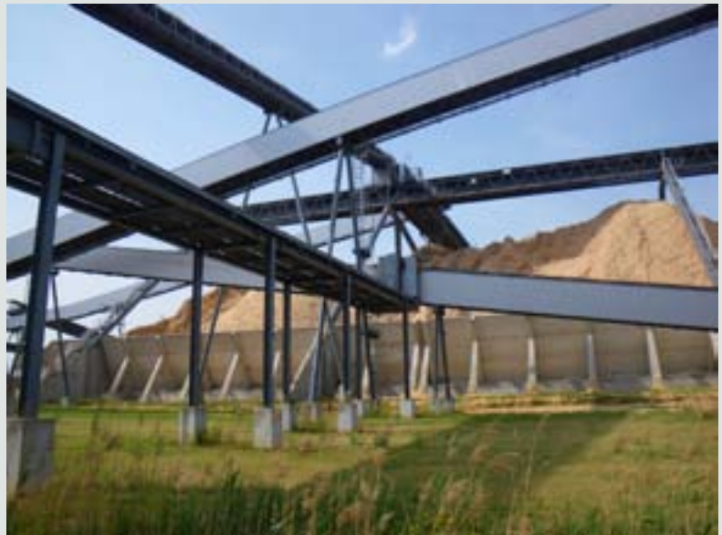
7. foto. Endise kavandatud tuumaelektrijaama alal asuv tselluloositehas (Arneburg, Saksamaa)

Endise kavandatava tuumaelektrijaama (Arneburg, Saksamaa) (vt 7. foto ) puhul maksis arendaja (kohalik omavalitsus) eraettevõtte omandis oleva maa taaslustamise eest, eesmärgiga tuua alale tööstusinvesteeringuid. Maaomanik oli maa soetanud 1993. aastal ja teinud sellel mõningasi lammustustöid. Pärast taaslustamisprojekti heakskiitu müüs maaomanik maatükid algse ostuhinnaga võrreldes palju kallimalt. Vastavalt kohaldatava riigiabi kava 36 sätetele oleks arendaja ja ehitaja vaheline leping pidanud sätestama ka maa müügist saadava kasu ülekandumise kohalikule omavalitsusele.