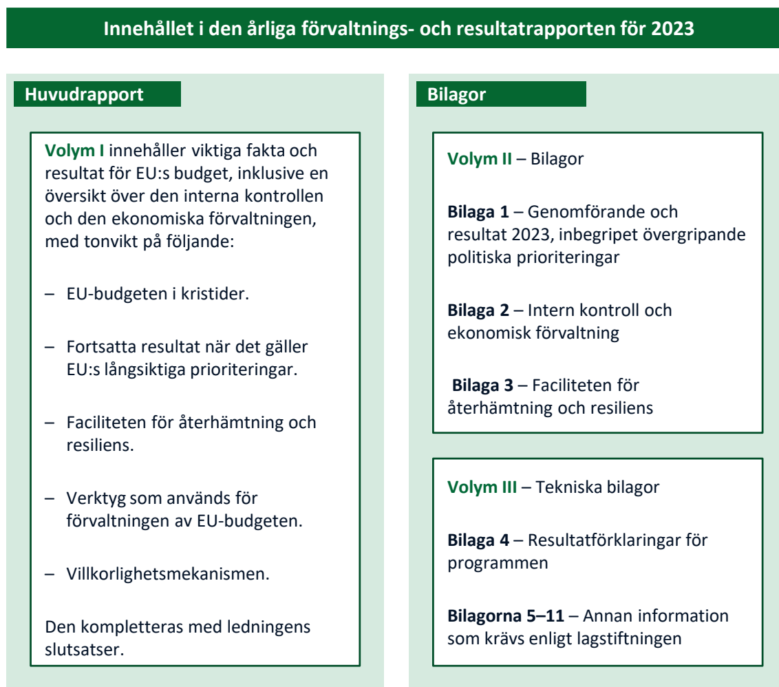
Figur 1 – Innehållet i den årliga förvaltnings- och resultatrapporten för 2023