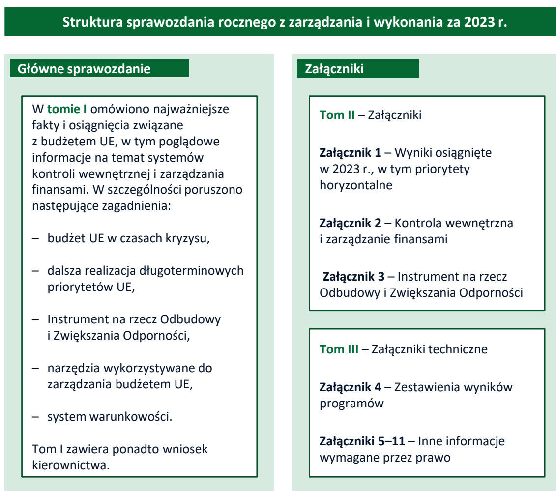
Rys. 1 – Struktura sprawozdania rocznego z zarządzania i wykonania za 2023 r.